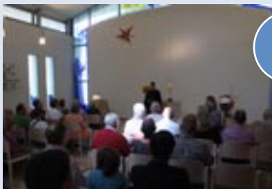
Vielen Dank den zahlreichen Gästen, die das Gemeindefest besucht haben