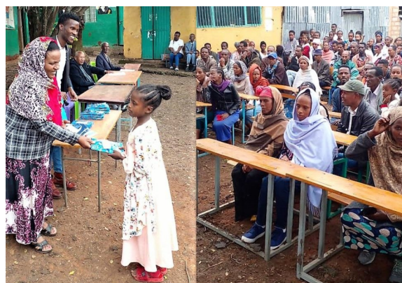
Abschluss Elementary Schule

Erinnern uns diese Bilder nicht auch an Schulabschlussfeiern hier bei uns?