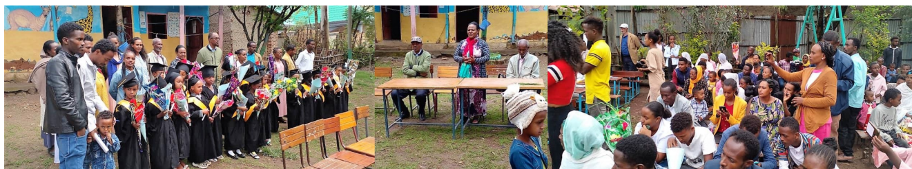
Abschlussfeier an der Vorschule (Kindergarten)

An Schule und Vorschule fanden die obligatorischen Abschlussfeiern unter Beteiligung der Kinder, deren Eltern und von Verantwortlichen der Schulbehörde statt. Traditionell haben wir wieder Bilder von diesen Abschlussveranstaltungen erhalten. Einige Bilder möchten wir hier zeigen.