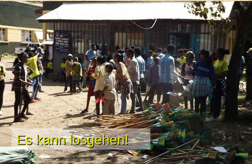
Es kann losgehen!