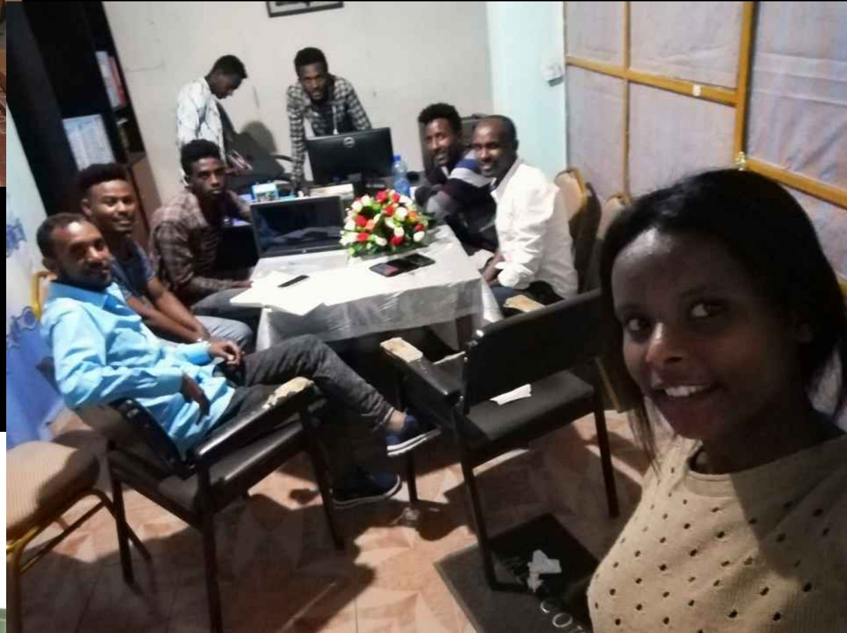
Das neue Büro im Aufbau