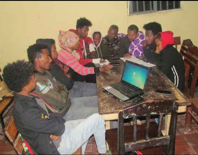
Ein Provisorium in der Kirche