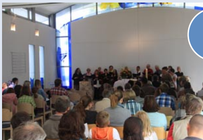
Worte und Taten – das war das Gemeindefest 2013